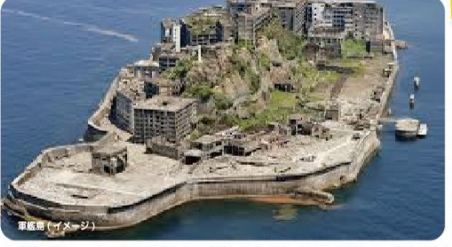
軍艦島上陸クルーズ・当日、天候により軍艦島に上陸できない場合は、周遊クルーズになりますのでご了承ください

矢太楼特得プラン特典 ①アウビの踊り焼きプレゼント ②夕食時90分飲み放題付 ③お部屋にウェルカムドリンク ④21:30よりホテルスタッフによる「夜景見学」へ