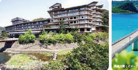
角島大橋(イメージ)