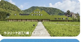
ラコリーナ近江八幡(イメージ)

1 宿毛駅(6:00発)ー中村駅(6:30発)ーSAにて各自昼食ー滋賀・ラコリーナ近江八幡<有名パームクーヘンや和菓子、を「えっ！ここどこ！？」そんな空間もお楽しみに>ー国宝・彦根城<江戸幕府の威光を示す名城をボランティアガイドの案内にて攻め入り！>ー長浜太閤温泉「グランドメルキュール楽園リゾート&スパ」(泊)「地元食材をふんだんに使った夕食ビュッフェは大人気！お部屋も広々リゾートホテル」