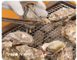
かき小屋(イメージ)

1 中村駅(6:30発)ー宿毛駅(7:00発)ーしまなみ海道ー宮島口・かき小屋「島田水産」<70分間牡蠣焼食べ放題！生産者ならではの新鮮な牡蠣を思う存分食べつくしてください>ー宮島口港ー宮島港ー宮島島内「神楽の宿・ホテルみやげ屋」(泊)「日本三景・安芸の宮島を満喫できるお宿」<到着後は現地案内人と厳島神社参拝し、その後は自由散策となります> 2 ホテルー宮島港ー宮島口港ー下瀬美術館<ユネスコ「世界で最も美しい美術館」・ベルサイユ賞を受賞！瀬戸内海と一体となった芸術を味わってください>ー柳井港〜(弁当)ー三津浜港ー宿毛駅(18:00着)ー中村駅(18:30着)