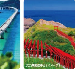
元乃崎神社(イメージ)